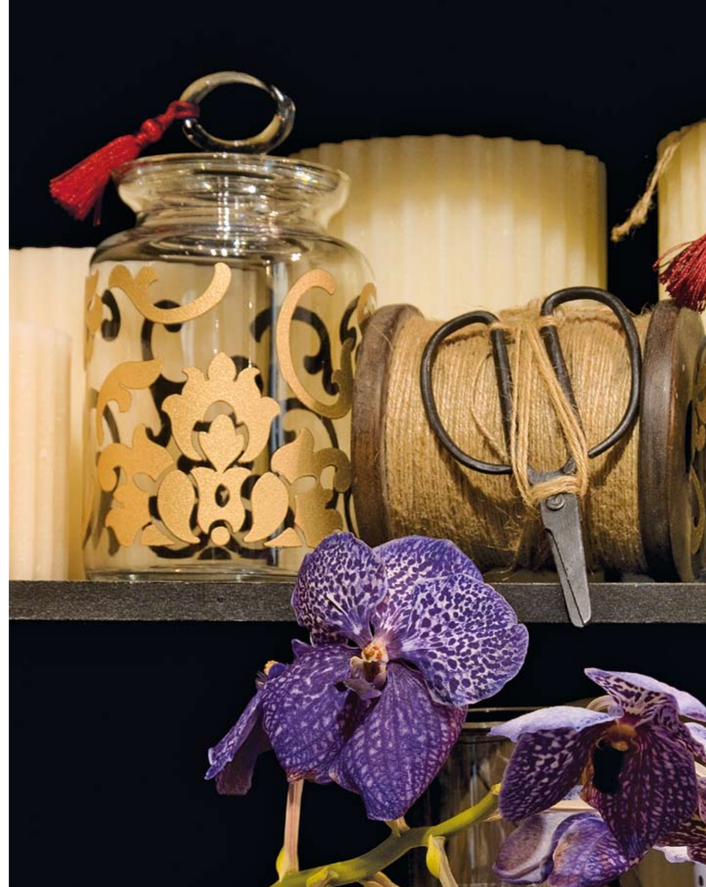
(Oro 24 Kt.) (24 Kt. Gold)