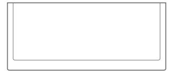
Coppa Cilindrica doppio spessore Cylindrical bowl double thickness H15 Ø35