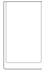
Vaso Cilindrico doppio spessore Cylindrical vase double thickness H25 Ø15